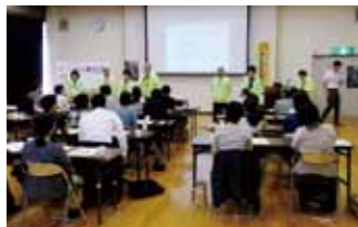
H30.6.12 須々万市民センター別館