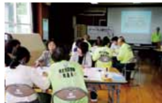
H30.6.29 周陽市民センター

*カフェにいるようなリラックスした雰囲気、少数のテーブルで自由に対話を行い、時々テーブルを移動して話し合いを発展させていく会議のこと。