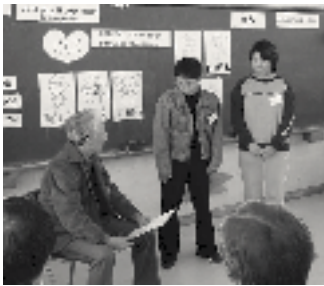
11月に長穂小学校で行われた木を対象にしたワークショップ

CAPはChild Assault Prevention (子どもへの暴力防止)の略。子どもたちが自身が、自分を暴力から守る力を発揮できるように支援するプログラムで、寸劇や話し合いへの参加を通して進められます。大人を対象にしたものもあります。