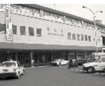
エスカレーター設置が計画されている徳山駅南口

エレベーターの設置については国の補助採択の見通しが立ち、エスカレーター設置の工事も一体的に整備することが望ましい。また、健康者や足腰の弱いお年寄りを含め、エスカレーター設置の要望は