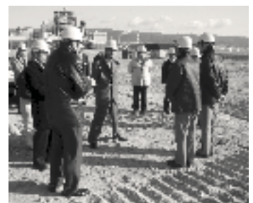
「新たに生じた土地の確認について」では審査前にT7埋立地を現地調査

可決すべきものと決定しました。競艇事業特別会計補正予算（第2号）では、質疑で「企画宣伝の担当者を1名採用することだが、どういう人を採用したのか。現状の職員では対応できない業務内容なのか」との問いに対し、執行部から「新規採用ではなく、市の職員を配置転換した。平成18年度に全国発売のG1競走である女子王座決定戦を誘致しており、これからさまざまに売り上げ向上策を展開して