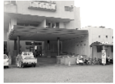
周南市社会福祉協議会が指定管理者に決まった老人休養ホーム嶽山荘