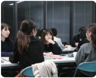
▲忙しい合間を縫って話し合いを続ける実行委員

「成人としての新しい世界が始まるという思いを込めて、『The beginning』というテーマで成人式を開催します。成人式では抽選会を行います。景品は市内の企業から提供していただいた物を含め、ふるさとにちなんだ物を多数準備しています。成人式に合わせて、周南市の魅力をたくさんPRしたいと思っています。新成人の皆さんには、自分のやりたいことを、意志を持ってやり遂げ、後悔しない人生を送ってほしいと思います」と、新たに成人の仲間入りをする若者たちに、笑顔でエールを送ります。