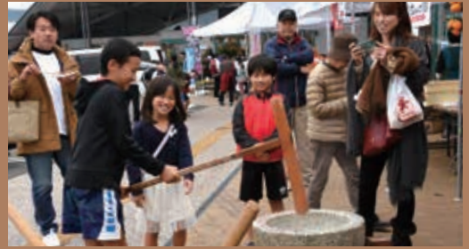
ステージイベントの他、湯野温泉の足湯や屋台村、餅つきの実演販売などがあり、多くの来場者が周南の秋を満喫しました。