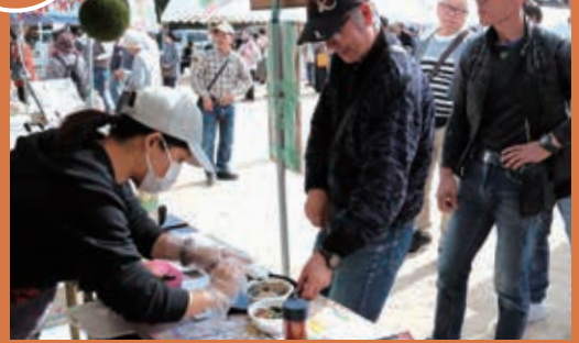
9つの団体が鍋やおでん、うどんなど、さまざまなオリジナル鍋を考案。来場者が長蛇の列を作っていました。