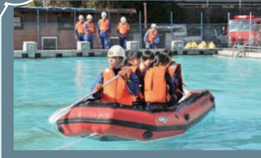
逃げ遅れ「ゼロ」をめざして、熊毛地域で防災訓練を実施。ボートでの救出訓練など、災害時の各自の行動を確認しました。