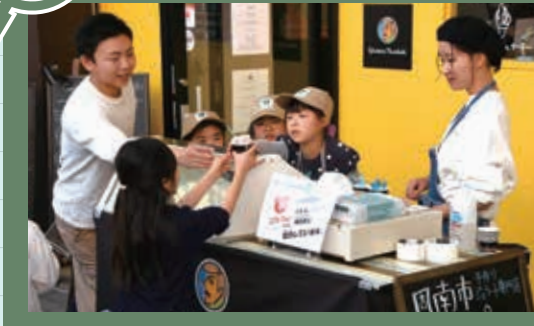
子どもたちがさまざまな職業を体験できるイベントが開催され、商店街は子どもの元気な声で、活気にあふれていました。