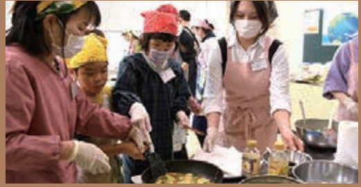
参加した約60人は、韓国・中国・ベトナムなど、6つの国のグループごとにそれぞれの国の料理を作り、食文化を通して交流を深めました。