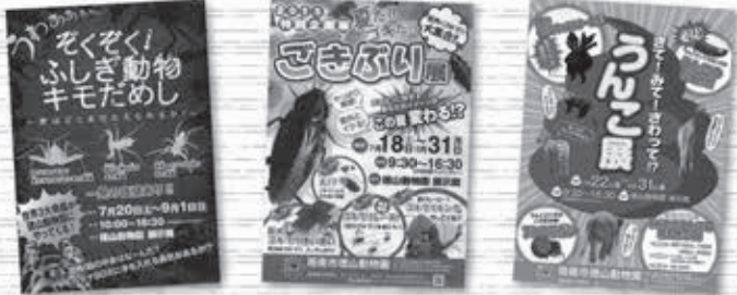
▲平成25年 ▲平成27年 ▲平成29年