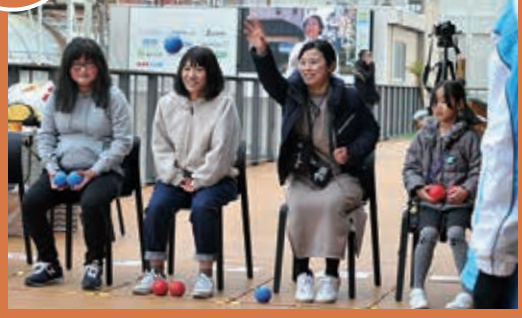
オープニングイベント後、パラスポーツの観戦方法や見どころなど100倍楽しむ講演やポッチャの体験が行われました。