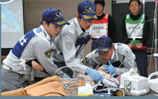
119番通報を受けて、救急隊員が現場で迅速かつ的確に処置し、医療機関へ引き継ぐための一連の訓練を実施しました。