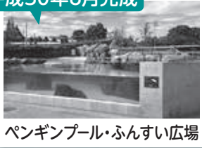
ペンギンプール・ふんすい広場