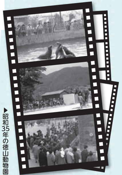
昭和35年の徳山動物園

来園者の皆さんが動物や自然環境の素晴らしさを体感できる動物園にするため、平成22年3月にリニューアル計画を策定し、整備を行っています。