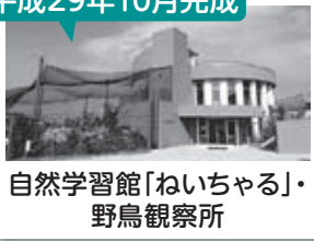
自然学習館「ねいちゃる」・ 野鳥観察所