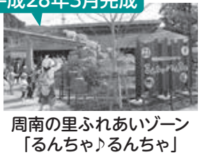
周南の里ふれあいゾーン 「るんちゃんるんちゃん」