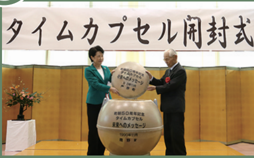
旧鹿野町の町政施行50周年を記念して埋設されたタイムカプセルが開封され、当時を懐かしむ声を聞くことができました。