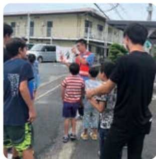
▲時には野外で勉強する企画もあります。

「大学の先生から紹介を受け、こどもハウス久米の立ち上げから関わっています。中学校の教員をめざしていて、子どもと関わる活動がしたいと思っていました。今年度は、参加した小学生に学校の勉強を教える、学習支援グループのリーダーを務めています。子どもたちが、年下の子どもに年長者として振る舞えるようになつたり、自分の意見が言えなかつた子どもが、自分の意見を言えるようになったりするのを見ると、子どもたちの成長を感じることができ、とてもうれしです」と活動のきつ