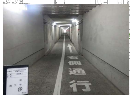
狭い地下道路面に通行区分の明示 自転車と歩行者の接触対策