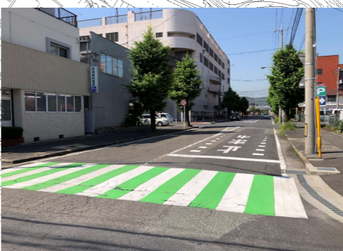
横断歩道カラー化、止まれの強調