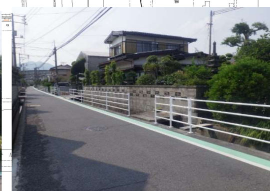
カラー区画線・路面標示による減速措置, カーブミラー更新