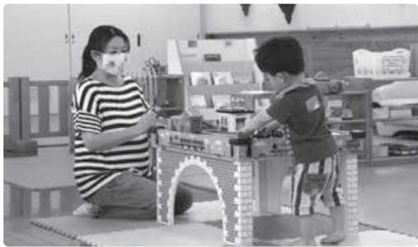
子育て交流センター ぞうさんの家

▲親子で楽しむためのおもちゃや絵本の他、授乳コーナーも設置しています。外には砂場や遊具があり、外遊びを楽しむこともできます。