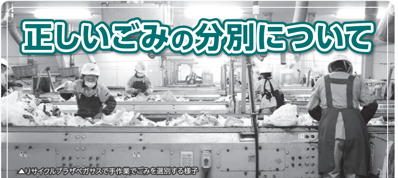
▲リサイクルプラザペガサスで手作業でごみを選別する様子

皆さんの家庭から出た燃やせないごみや資源物は、リサイクルプラザペガサスに搬入され、異物などを取り除く作業を全て人の手でを行っています。刃物や注射針、発火のおそれがあるごみなどが混入すると、選別する作業員のけがや感染症、施設の火災発生につながる危険があります。