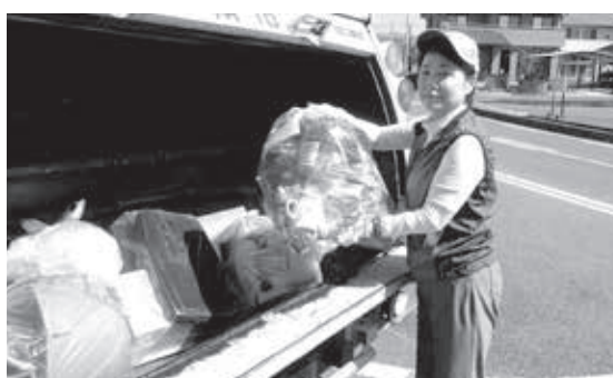
▲市長もごみ収集を体験しました

→小型家電回収ボックスに出してください。火災の危険があるため、定期収集では回収していません。