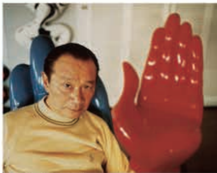
「岡本太郎」

昭和47～52年(1972～77)にかけて『日本カメラ』に連載されたものをまとめた写真集『日本の画家108人』。画家の背景には、作品やアトリエなどが写し込まれています。