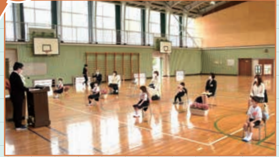
市内の小・中学校が再開し、湯野小学校では4人の新1年生が今後の学校生活に胸を膨らませ、初登校しました。