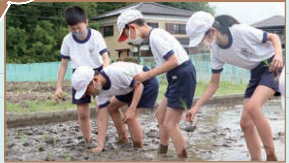
櫛浜小学校5年生が、校内の田にもち米の苗を植えました。育ったもち米は、地区の文化祭で餅つきに使われる予定です。