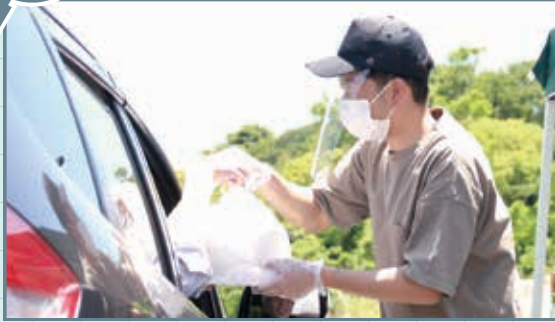
新型コロナウイルス感染拡大により生活環境が変化する中、市内の飲食店が、ドライブスルー形式で弁当を販売しました。