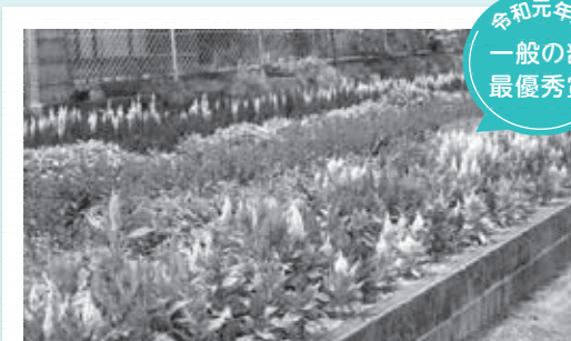
須々万おやじの会「須々万花壇」