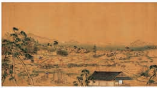
伝大森学禮 「徳山真景図」 徳山毛利家蔵