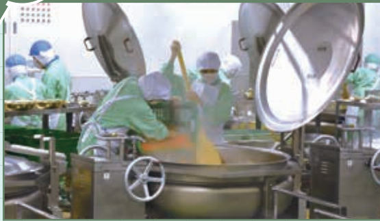
市西部の小・中学校14校へ給食を供給するため、4月に整備されたセンター。学校の再開に合わせ、この日、初稼働を迎えました。