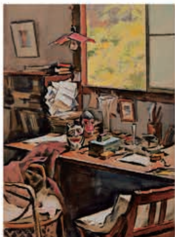
河上大二(室内) 水彩・紙