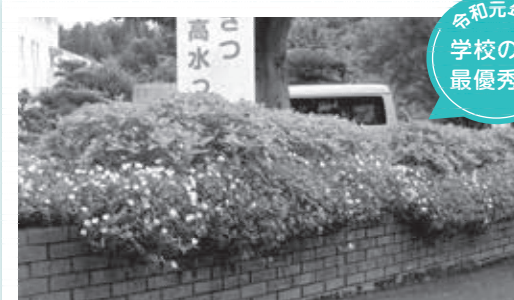
高水小学校「高水小学校花壇」