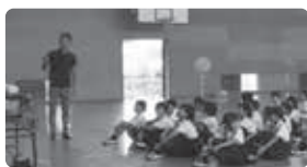
▲小学生を対象に防災講座を実施

市では、防災に関する豊富な知識や経験を持った人を防災アドバイザーとして委嘱しています。地域の防災活動を行う団体(自治会・自主防災組織など)を対象に、申し込みに応じて防災アドバイザーを派遣します。