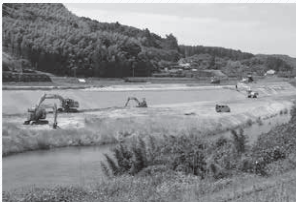
▲島田川の護岸復旧工事