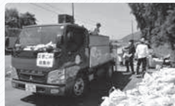
▲被災ごみを仮集積所へ運搬