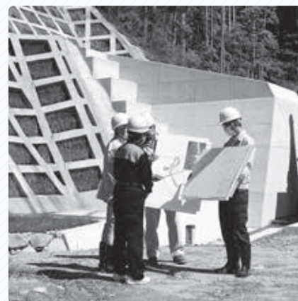
▲砂防ダムについて質問する市長

関係機関や自主防災組織との連携をさらに強化し、市民の皆さまが自発的に適切な避難行動を取ることができる体制づくりを進めています。