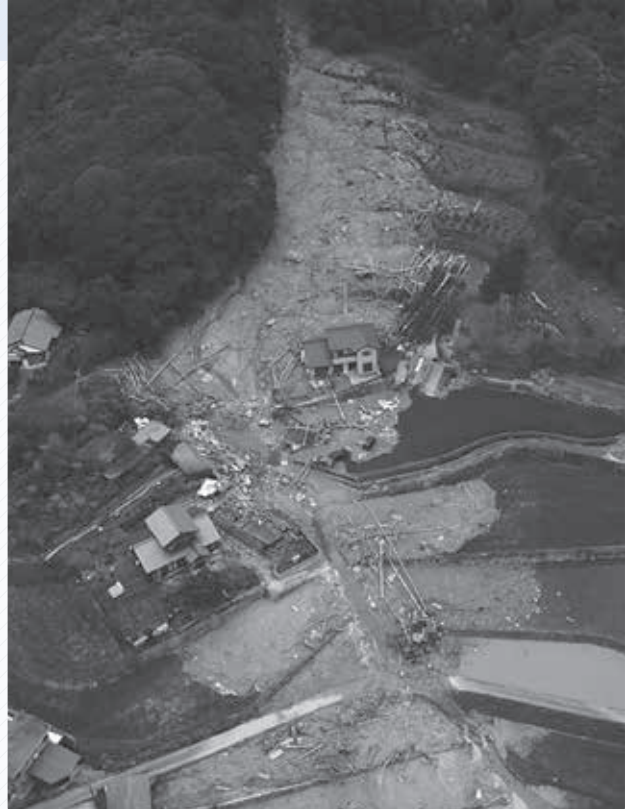
▲土砂災害発生直後の熊本地域小成川地区