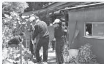
▲被災ごみを撤去する学生ボランティア