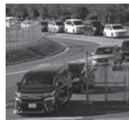
▲順番を待つ車の列