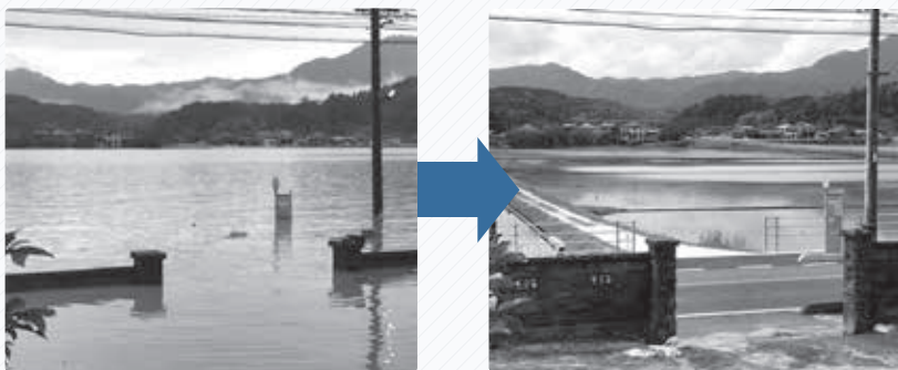
▲深刻な浸水被害が発生した熊本地域三丘地区では、復旧工事が終わり、稲作が始まりました。