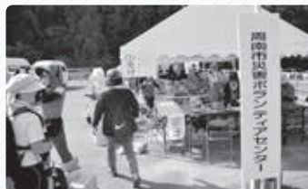
▲災害ボランティアセンターの開設