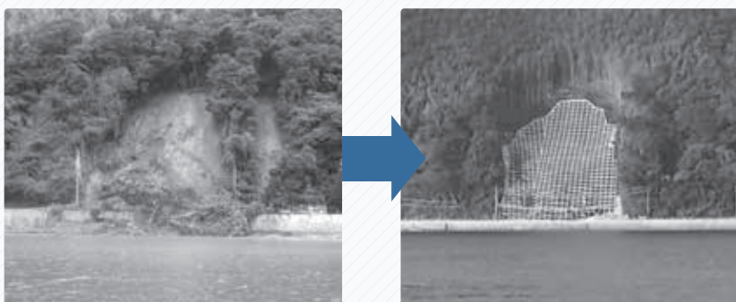
▲大津島では大規模な土砂崩れにより、市道が通行止めとなりましたが、令和元年11月に復旧しました。