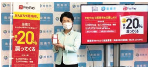
▲キャッシュレス決済のキャンペーンの紹介をする市長