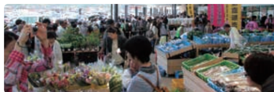
▲道の駅ソレーネ周南