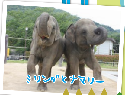
ミリンダとナマリー

もっているクールとヒートをくらべてみてね。未来の地球のために、いろんなエコに取り組んでみよう!