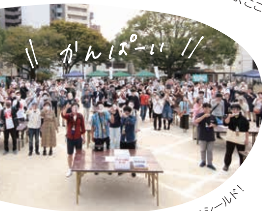
周南地酒横丁、参加者みんなでフェイスシールド!