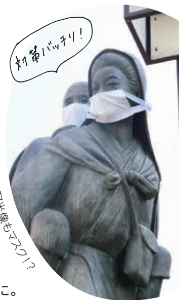
女子阿米像もマスク!?