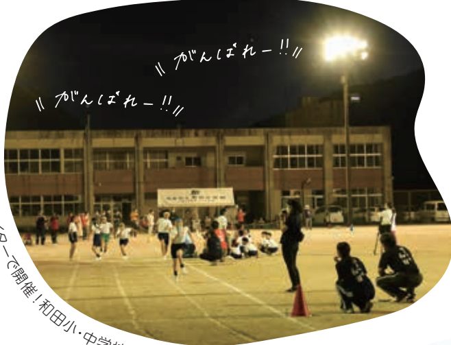
メーターで開催! 和田小・中学校運動会!