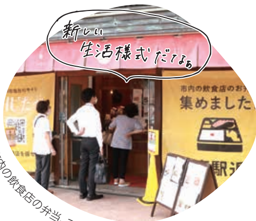
市内の飲食店の弁当、ここに集合!