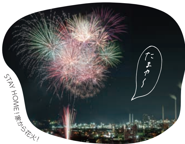
STAY HOME! 家から花火!