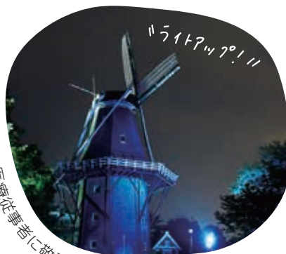
医療従事者に敬意を表して…