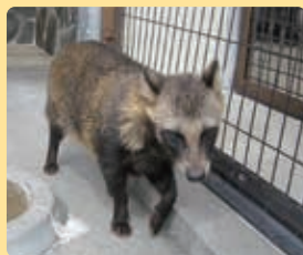
▲夏毛のタヌキ 体がほっそりして見えます

冬の寒い時期、タヌキは丸々とした姿に見えます。それは寒さをしのぐための、毛足の長いふわふわの冬毛がたっぷりと生えているからです。これから夏に向けて、その冬毛が徐々に抜け落ちていきます。人間が衣替えをするように、タヌキも暑い時期と寒い時期で姿が異なります。すっきりとした夏毛の姿に変わっていく様子を観察することができるのは今の時期だけです。