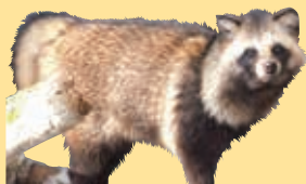
▲冬毛のタヌキ ふわふわして、とても温かそう

冬の寒い時期、タヌキは丸々とした姿に見えます。それは寒さをしのぐための、毛足の長いふわふわの冬毛がたっぷりと生えているからです。これから夏に向けて、その冬毛が徐々に抜け落ちていきます。人間が衣替えをするように、タヌキも暑い時期と寒い時期で姿が異なります。すっきりとした夏毛の姿に変わっていく様子を観察することができるのは今の時期だけです。