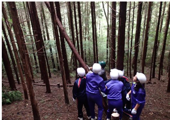
徳山試験地での間伐体験