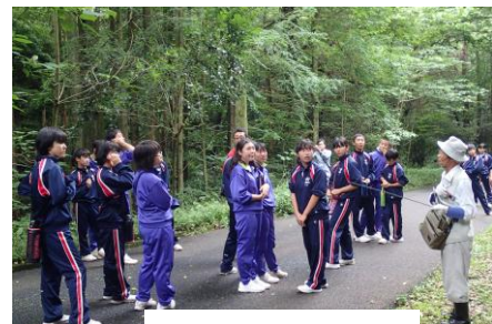
西緑地での自然観察