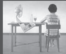
寺井力三郎 「扇風機」 1977年 油彩・キャンバス