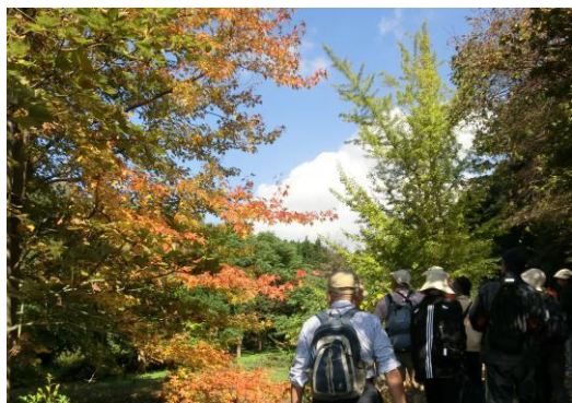
午前は徳山試験地を散策しました

平成24年度に締結した周南市と京都大学フィールド科学教育研究センターとの連携協定に基づく事業の一つとして、公開講座が行われました。この講座は、実際の現場で自然や環境の変化を体験することによって、森・里・海の連環を学ぶことを目的としています。今回は、京都大学フィールド科学教育研究センター徳山試験地と西緑地を見学しました。23名の参加者の皆さんは、専門的な興味深いお話を聞きながら、緑豊かな森の中を散策することができました。晴天にも恵まれ、たいへん充実した講座となりました。