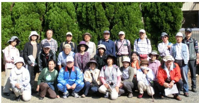
講師の先生と参加者のみなさんで記念撮影