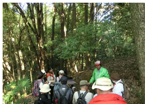
午後は西緑地です