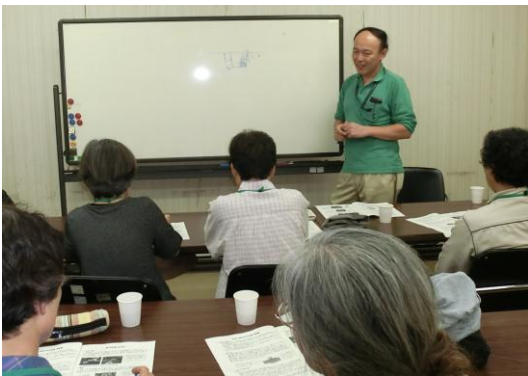
まず土作り等の講義です。