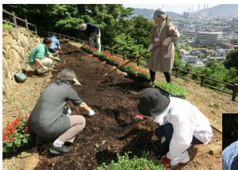
その後で実習です。