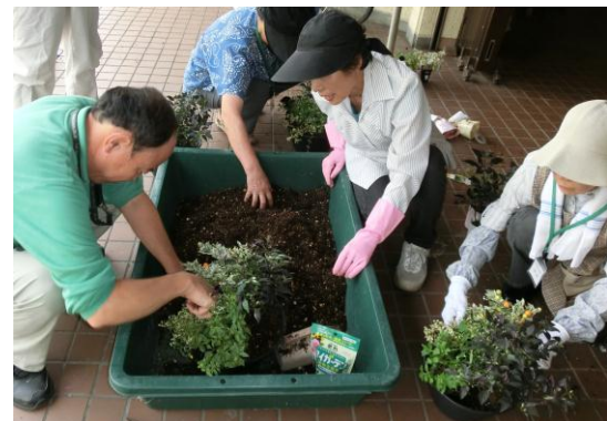
その後で寄せ植え実習です。