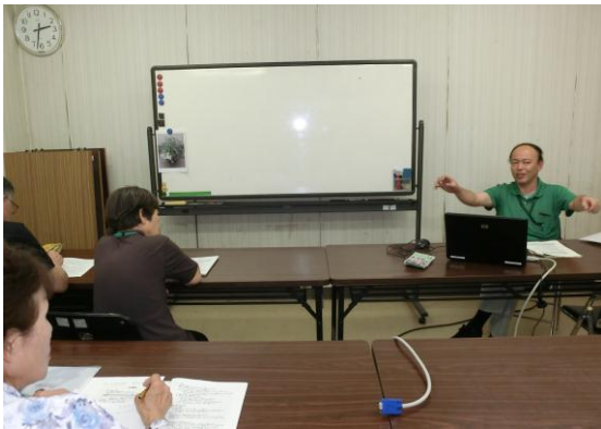
植物の管理方法についての講義