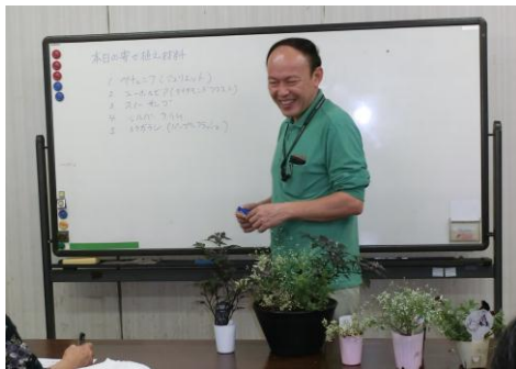
まず植物の特性について講義です。