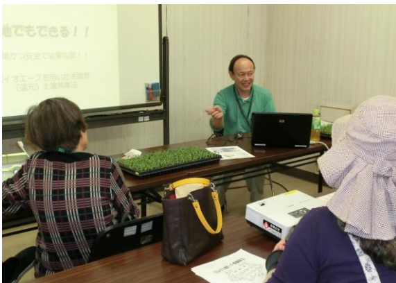
肥料の特性についての講義