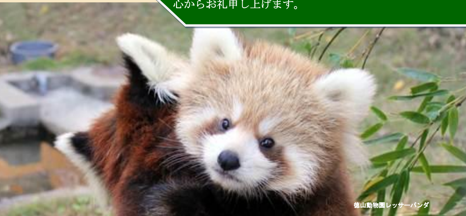
徳山動物園 レッサーパンダ