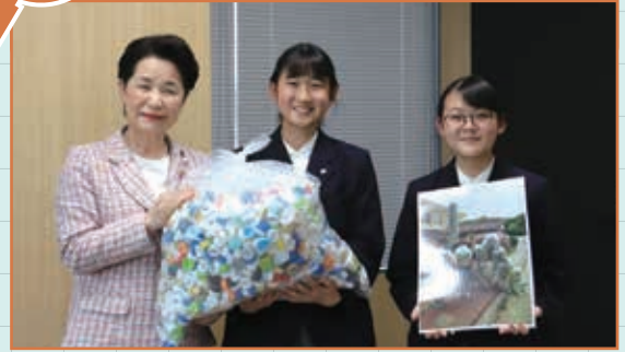
岐陽中学校より、60人分のポリオワクチンに還元される、ペットボトルキャップ120キログラムが贈呈されました。