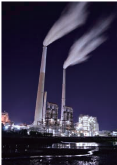
▲ U-18の部 最優秀賞受賞作品「宇宙まで」