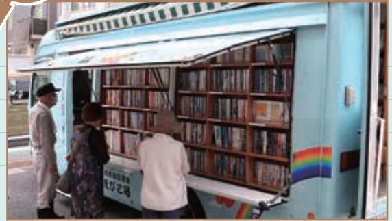
図書館を利用しにくい市民のため、市内各地を約4,000冊の本を載せて定期的に巡回を行っています。