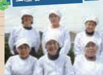
企業組合しゃくなげの皆さん