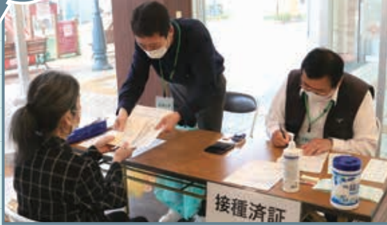
65歳以上の人を対象にした新型コロナウイルスワクチン接種を、市内各地で開始しました。