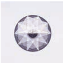
1977 (昭和52)年4月15日 墨、ペン、ホワイト、紙

今回は、67歳の時に出版された童謡集の表紙絵です。まどさんは40代の頃、『チャイルドブック』の編集者をしていました。そこでは童謡のほか絵やカットも描いています。「どうしたら子どもたちに見てもらえるだろうか」。この作品からもそんな気持ちが伝わってきます。大きな円の中心にまた円があり、上部が木の枝で下部が根っ子のように見えます。左右対称かと思うと枝の部分が微妙に違って見えます。自然とそこに目が行きませんか。※この作品は6月30日(水)まで展示しています。