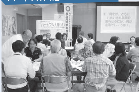
【令和元年度 勝間市民センター】