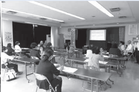
【令和2年度 高水市民センター】