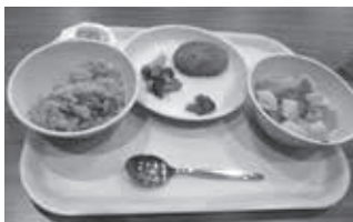
学校給食の「のんたこ飯」