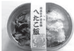
ソレーネ周南で販売されている「へたこ飯」