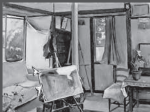
河上大二「イーゼルのある部屋」 1930年 水彩・紙