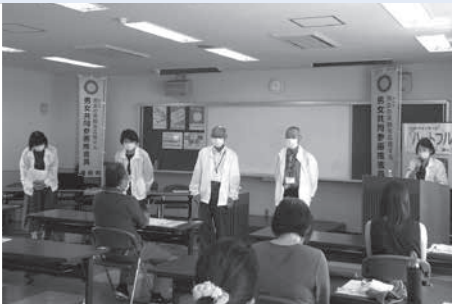
【令和2年度 新南陽ふれあいセンター】