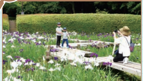
梅雨の晴れ間となったこの日、見頃となったハナショウブが多くの人の目を楽しませていました。