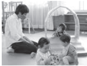
▲子育て交流センターぞうさんの家

妊娠中や産後の自分の体のこと、お子さんのこと、おっぱいのことなど、助産師に相談してみませんか。希望者には、身体計測も行っています。妊婦さんの相談や子育て支援センター見学も受け付けています。