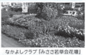
なかよしクラブ「みささ若草会花壇」