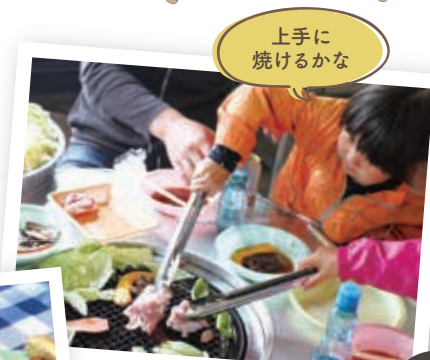
上手に焼けるかな