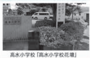
高水小学校「高水小学校花壇」