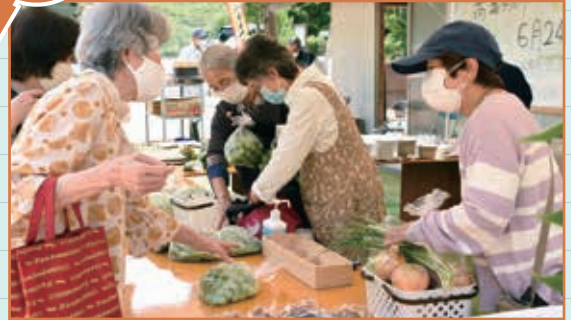
毎月開催され、高瀬の特産品や新鮮な野菜などが販売されています。顔なじみ客も多く、地域の憩いの場にもなっていました。