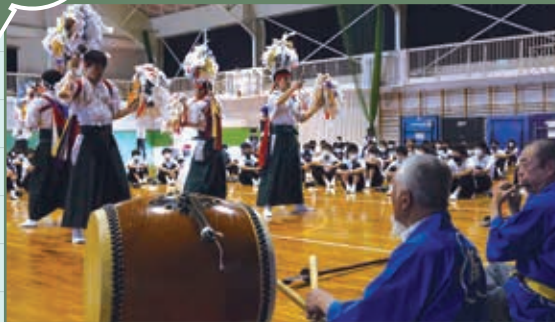
和田中学校の統合先である、富田中学校での伝承活動の継続をめざし、三作神楽保存会により講話や舞の上演が行われました。