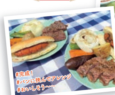
#完成! #パンに挟んでアレンジ #おいしそう〜