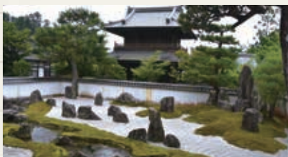
きよくすい ▲曲水の庭(平安・鎌倉・室町様式)