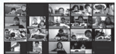
▲令和2年度の開催の様子