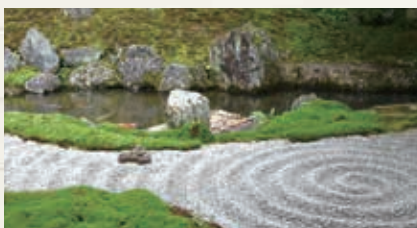
くせん はっかい ▲九山八海の庭(鎌倉様式)