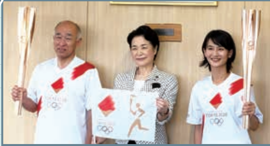
本市ゆかりの聖火ランナー2人が、聖火リレートーチとユニフォームを、市長に披露しました。