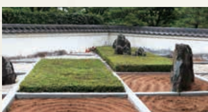
しょうしょうはつがい ▲瀟湘八景の庭(近代モダン様式) ※通常は非公開です。

国の文化審議会が、漢陽寺(鹿野地域)の庭園を、国の登録記念物(名勝地関係)に登録するよう文部科学大臣に答申しました。記念物登録の答申は、市内では初めてです。今後、登録について官報に告示され、正式に登録されることとなります。