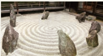
じざう ゆうげ ▲地藏遊化の庭(室町様式)