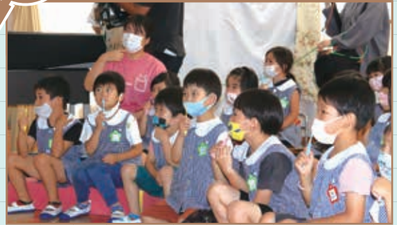
園児たちは、講師と一緒にオンラインで歯みがき・うがいの練習をし、おやつを食べ方や虫歯について学びました。