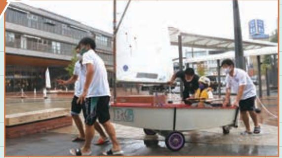
海の環境をさまざまな視点からとらえ、海について考えるイベントが2日間にわたって開催されました。