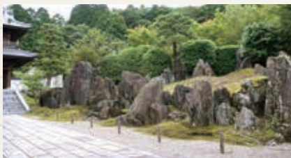
そうげんいつてき ▲曹源一滴の庭(桃山様式)