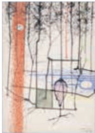
1961 (昭和36)年11月4日 水彩、紙