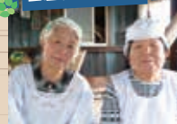
鹿野高齢者生産活動センター加工部より

天候や火加減によって焼き具合が変わるため、もみを炒る作業は、長年の経験と技が必要な作業です。高齢の人にはおなじみですが、ぜひ若い人たちにも食べてほしいです。お湯と少量の塩を加えて食べるのがお薦めです。