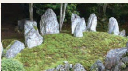
ほうらいざん ▲蓬萊山池庭(鎌倉様式)