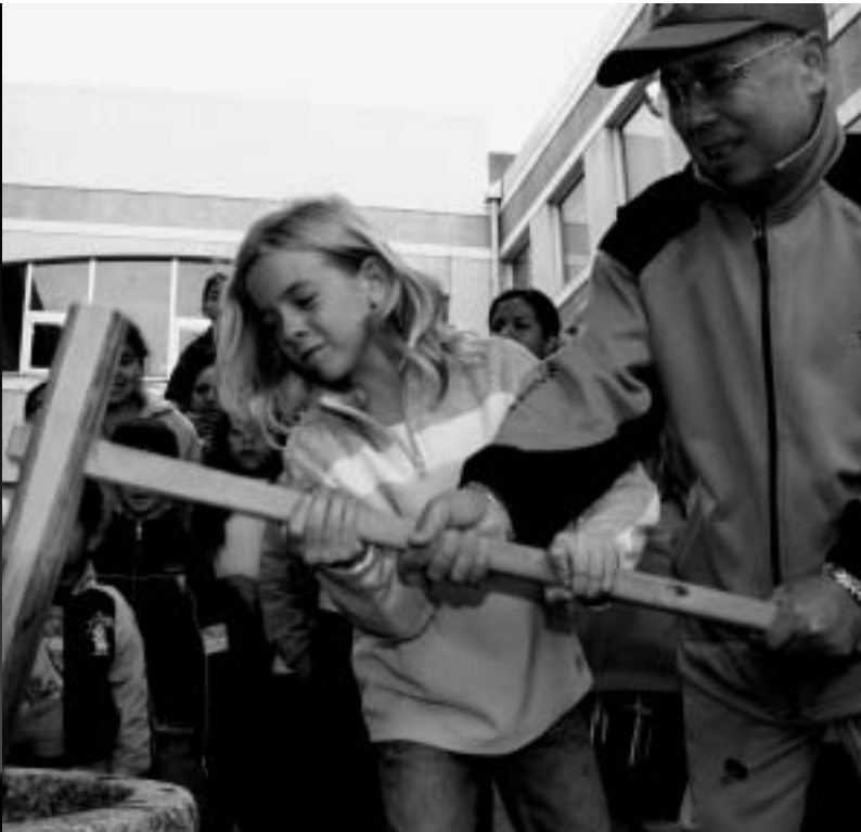
きねを「とっても重い」と歯を食いしばりながら、もちつきに挑戦。ついたもちば、みんなで丸めておいしくいただきました