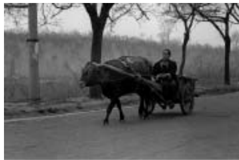
陝西省韓城市(黄土高原の村)