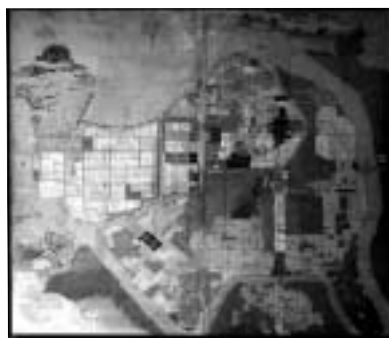
萩藩城下町絵図 (はぎはんじょうかまちえず) 幅186cm×高さ174cm