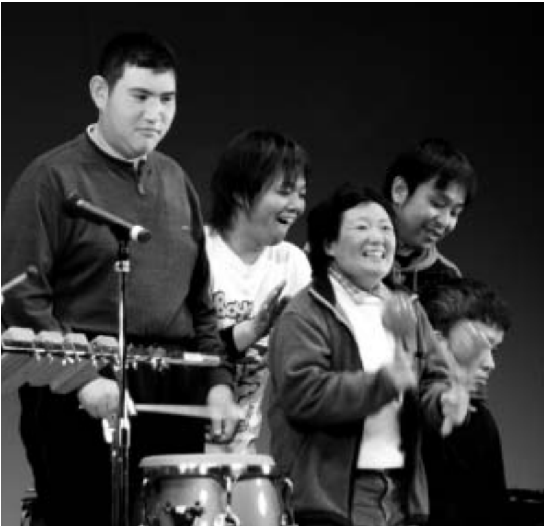
舞台の上で軽快な音楽を披露する皆さん。いきいきとした表情が印象的でした