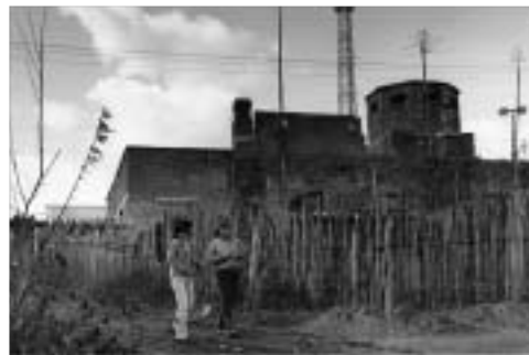
黒竜江省樺川県(満蒙開拓の村)