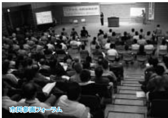
市民参画フォーラム

このように、家庭の中のことを家族みんなで話し合うように、市が行うまちづくりのことを、このまちで生活する市民の皆さんで考えて、市のいろいろな計画づくりや事業に、意見を出したり、提案することを市民参画といいます。