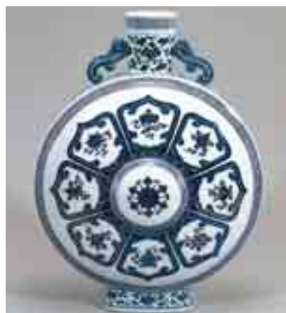
青花吉祥文扁壺 中国 景德鎮 清時代

出光美術館所蔵 陶磁の道 ヨーロッパで愛された東洋の陶磁器。出光美術館が所蔵する膨大なコレクションの中から、17・18世紀 中国や日本から輸出された磁器とヨーロッパ各地で生産された陶磁器など152点を展示し「陶磁の東西交流「陶磁の道」をたどります。