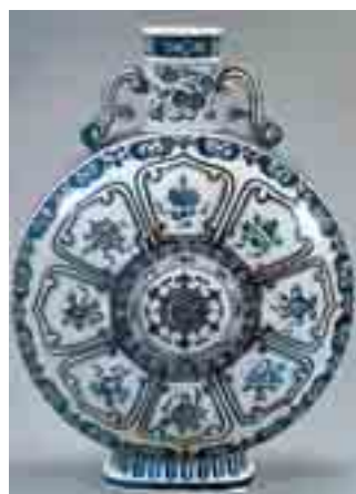
白地藍彩吉祥文扁壺 オランダ デルフト 18世紀

S席8,400円 A席6,300円 B席5,250円 C席3,150円 【プレイガイド】文化会館・近鉄松下 他