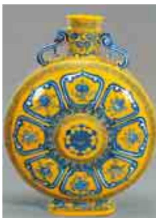
黄釉藍彩吉祥文扁壺 フランス セーブル 18世紀