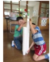
高く積み上げよう頑張ろう