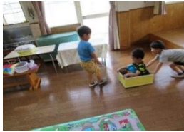
今度は僕が押すよ