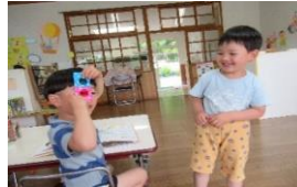
何色に見えるかな