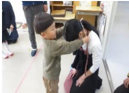
遊んでくれてありがとう