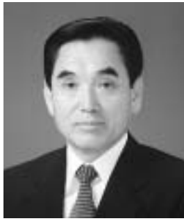
周南市長 河村和登

5月25日に行われた周南市長選挙の結果、初代市長は河村和登氏に決まりました。県勢発展をリードする元気発信都市の創造に向けた新たなまちづくりが、いよいよ本格的にスタートします。