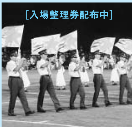
【入場整理券配布中】

日時 8月30日(土) 18時～21時 場所 市野球場(徳山・周南緑地公園内) 入場料 無料。ただし、入場整理券が必要です。整理券は、市役所本庁及び各総合支所受付、商工観光課、徳山商工会議所、周南警察署受付で配布中 催し内容 ●花火ファンタジー 特殊効果レーザー花火ショー／打ち上げ花火の饗宴 ●ミュージカルナイター 山口県・福岡県警察音楽隊ドリル演奏／山口県警察本部交通機動隊白バイドリル演技／MUREJユニアマーチングバンド／福川小学校マ