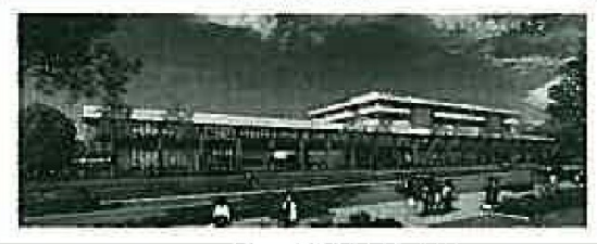
〔周南市新庁舎 「平成30年8月オープン予定」〕

◆ しゅうニャン市プロジェクト ～平成28年1月に策定した「周南市まち・ひと・しごと創生総合戦略」に基づき、本市ならではの魅力を発信するシティプロモーション活動。