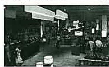
徳山駅前 賑わい交流施設 「平成30年 2月開館予定」

この一連の大変化をまちの活性化につなげ、市民の幸福度を高めていく。その大きな目標に向け、この二度とない千載一遇のチャンスを最大限に生かし、本市の魅力を発信するシティプロモーションを、市役所が一丸となって、市民の皆さんと共に推進します。