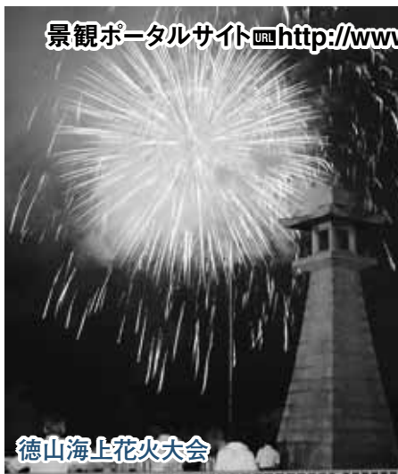
徳山海止花火大会

景観ポータルサイト http://www.city.shunan.lg.jp/section/toshi/toshikei/matidukuri/keikanpo.jsp