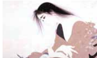
「恋花」水彩画 1986年 ©中島潔

中島潔（1943～）の30年以上にわたる画業を振り返り、20歳代～60歳代までの代表作約140点を「童画」「美人画」「源氏物語」のテーマに分けて一堂に展示。見る者を優しく包み込む中島潔の作品の世界をご堪能ください。