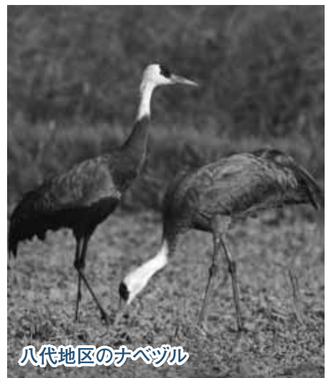
八代地区のナベヅル

うと、取り戻すのに多くの時間がかかります。 景観形成と保全は、私たちの生活に快適さと安らぎを与え、心の豊かに満ちた生活をもたらします。 良好な景観は、まちの質を高め、まちに活気を呼び起こすことも期待できます。その効果は、経済や観光の観点からも大きなものがあります。