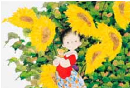
「真夏の夢」水彩画 1997年 ©中島潔