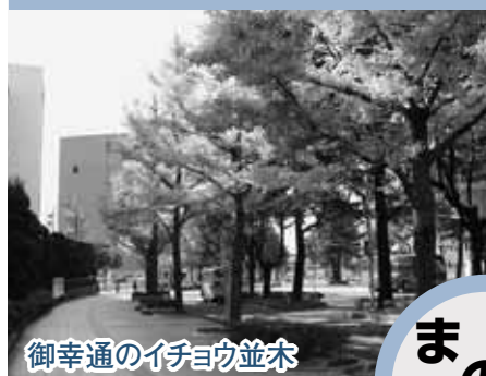
御幸通のイチョウ並木