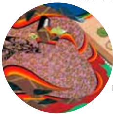
「源氏物語第四十八帖 早蕨 誰にか見せむ (中の君)」 日本画 1998年 ©中島潔