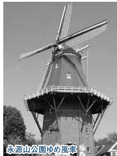
永源山公園ゆめ風車