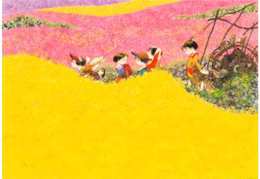
「花かずら」水彩画 2003年 ©中島潔