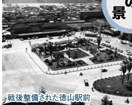
戦後整備された徳山駅前