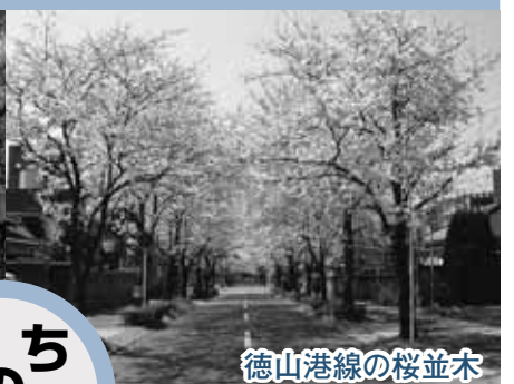
徳山港線の桜並木