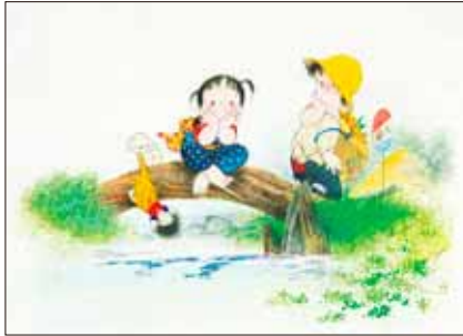
「川辺の詩」水彩画 1990年 ©中島潔