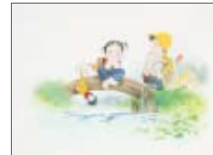
「川辺の詩」 水彩画 1990年 ©中島潔

6月5日(金)~7月20日(月・祝)月曜日休館 ※ただし7月20日(月・祝)開館 午前9時30分~午後5時(入館は4時30分まで)