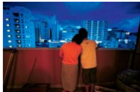
壊れた脳とともに生きる - 山田規敏さんの暮らし