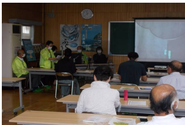
令和3年7月16日【岐山市民センター】