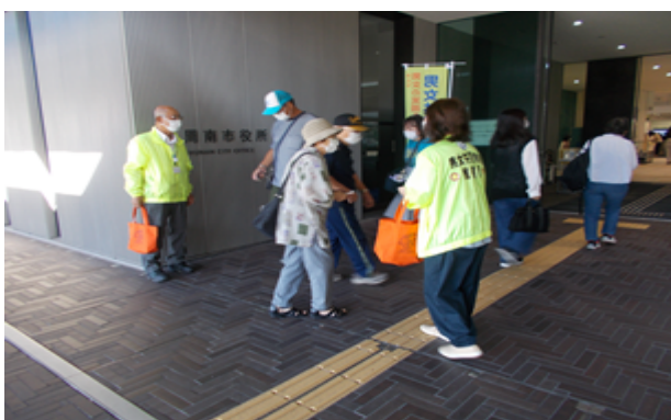
令和3年10月4日【本庁舎ピロティ】