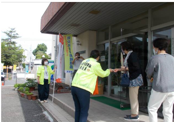
令和3年6月28日【桜木市民センター】