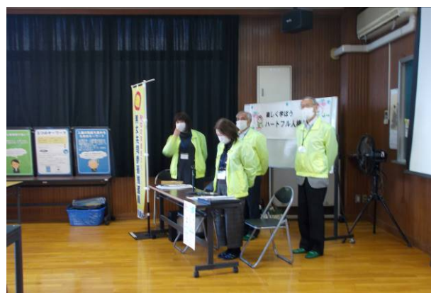
令和3年11月17日【周陽市民センター】