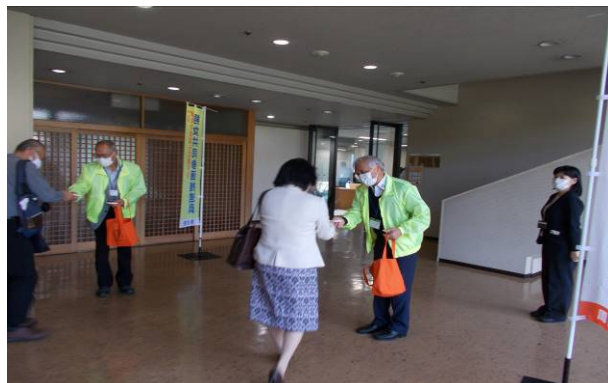
令和3年10月26日【文化会館】