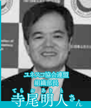
ユネスコ協会連盟 組織部長