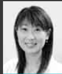
スポーツコメンテーター (元日本代表アトラクティブバスケットボール選手)