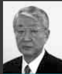
東京大学名誉教授