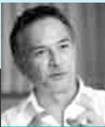
地域経済開発プロデューサー