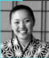
旅館女将 地域振興・地域再生の実践者