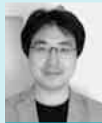
環境エネルギー政策研究者