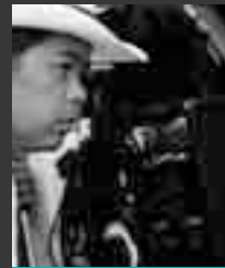
映画監督 徳山大学客員教授