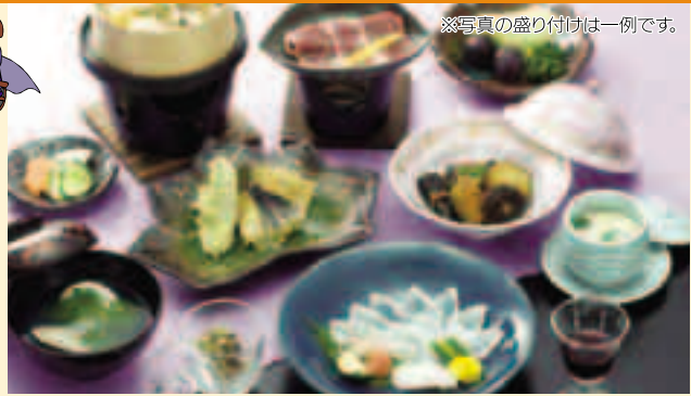
※写真の盛り付けは一例です。