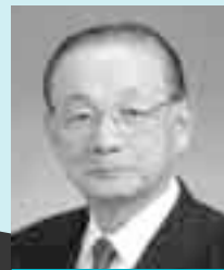
事務機器・医療設備製造販売会社 社長