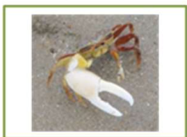
シオマネキのなかま