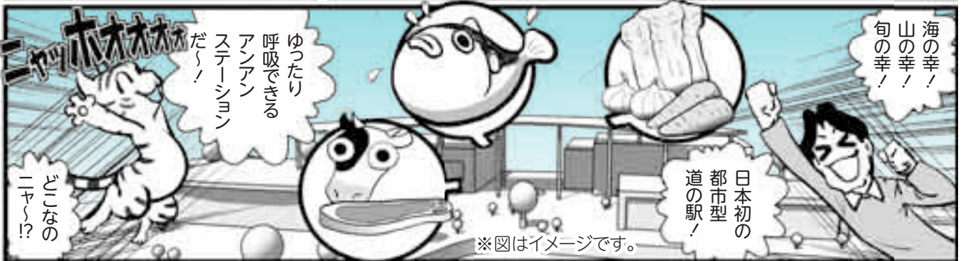
※図はイメージです。