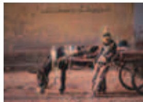
第1回 林忠彦賞受賞作 『西域—シルクロード』

林忠彦賞20回を記念して、第1回から19回までの歴代受賞作(代表作)と新作を一堂に展示します。併せて第20回林忠彦賞受賞作も展示、日本の写真の歩みをご覧ください。