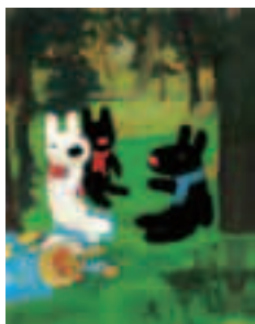
『リサとガスパールのピクニック』 Hachette Livre©2006 Anne Gutman and Georg Hallensleben

フランスの絵本「リサとガスパール」そして「ペネロペ」。どちらも人気のシリーズです。作者のゲオルグ・ハレンスレーベン・アン・グットマン夫妻によって生み出される明るく楽しく優しい世界を、美しい原画でお楽しみください。