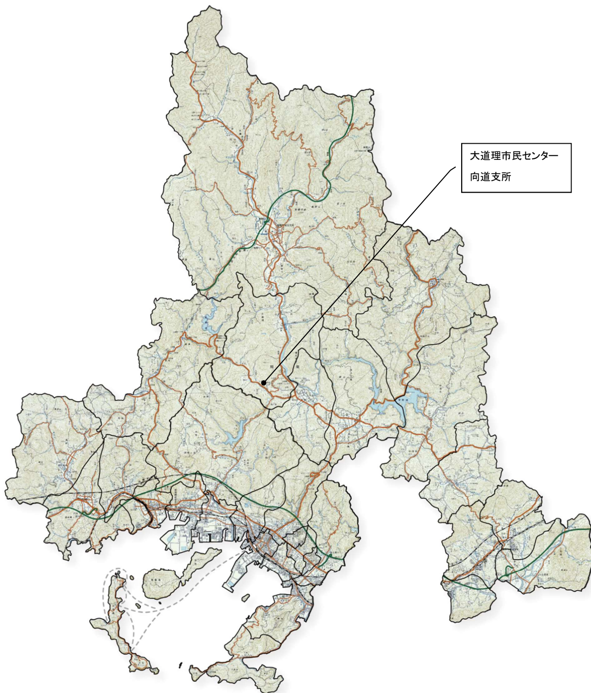
図表 2 施設位置図