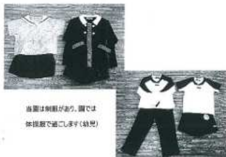
当園は制服があり、園では 体操服で過ごします(幼児)