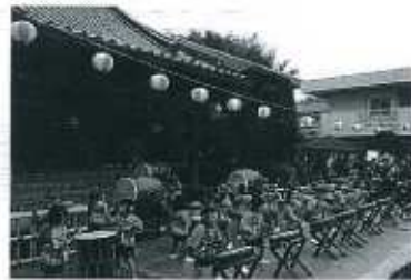
あきまつり (奉迎館から見た様子)