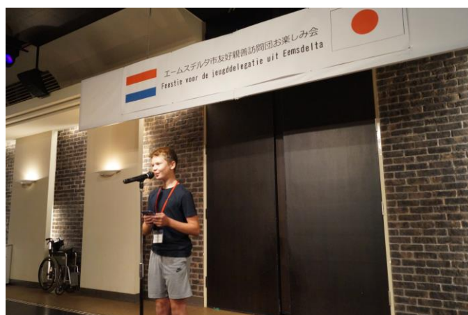
お楽しみ会（青少年のあいさつ）