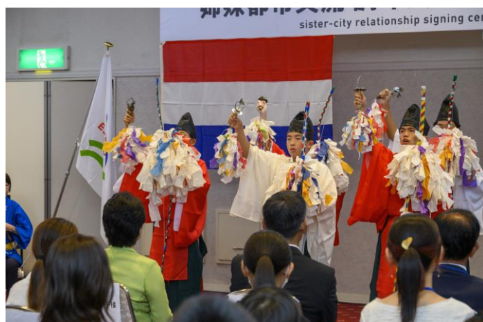
三作神楽クラブ・三作神楽保存会による演舞