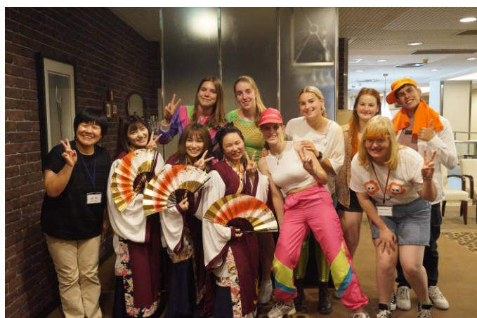
お楽しみ会（周南誠友会の方々と）