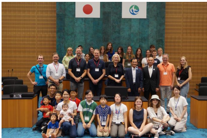
市役所見学（議場にて記念撮影）

大人たちはその後、日本酒講座を受講し、周南工場夜景を見ながら食事を楽しんでもらいました。