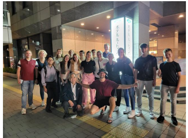
福岡市内ホテルにて