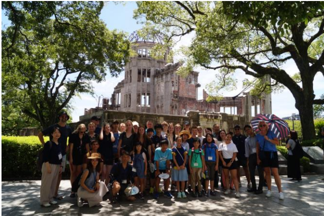
平和記念公園視察

この日は、訪問団のための希望により、広島平和記念資料館及び平和記念公園を視察しました。その後、広島駅に移動し、お好み焼き体験、駅周辺の散策をしました。