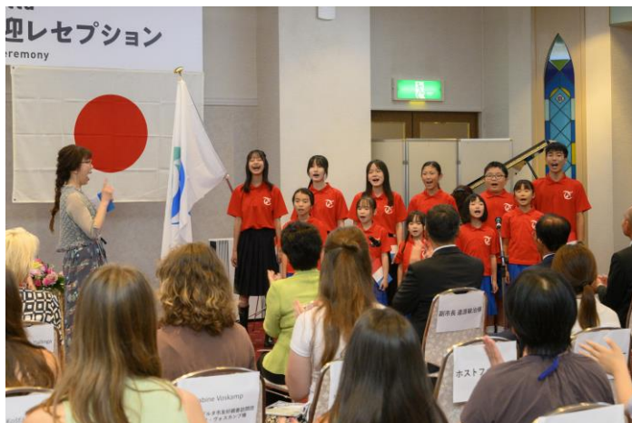
周南青少年少女合唱団による合唱

無事、周南市に到着した後はホテルサンルート徳山（3階銀河の間）で調印式を行いました。その後、引き続き歓迎会（引渡式）を行い、青少年たちはそれぞれのホームステイ先へと向かいました。