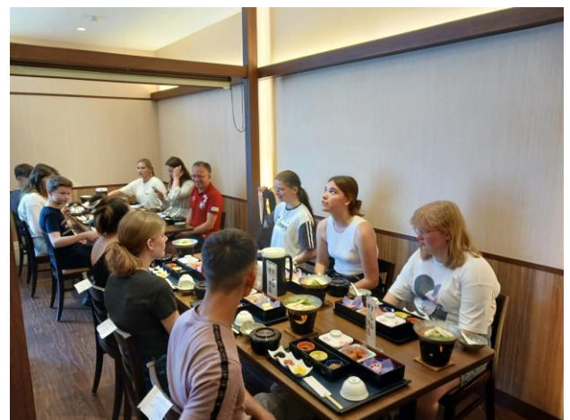
昼食@博多はねや総本店