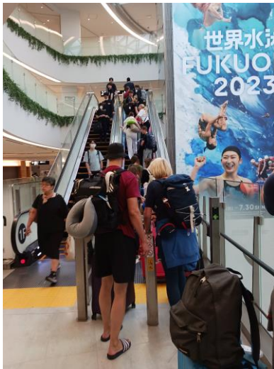
福岡空港内を移動

訪問団一行はこの日17時50分着の便で福岡空港に到着しました。この日は福岡空港で夕食を取り、そのまま福岡市内のホテルに宿泊しました。