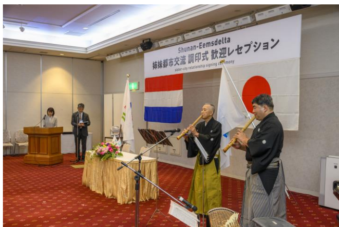
周南邦楽連盟による琴と尺八の演奏