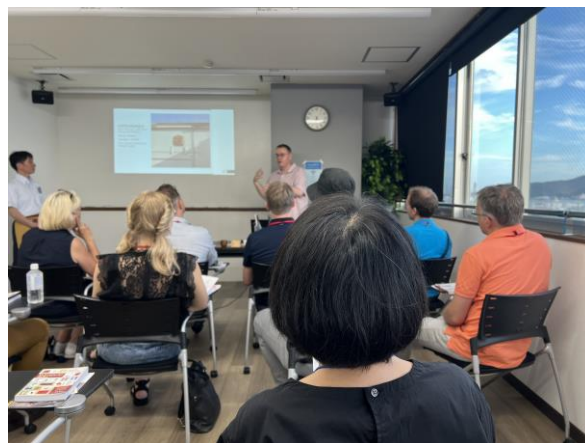
日本酒講座@CROSS SPACE 紡