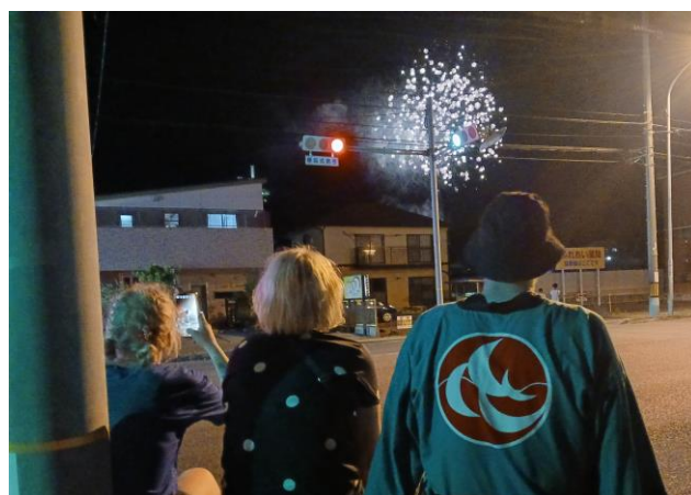
サンフェスタしんなんよう