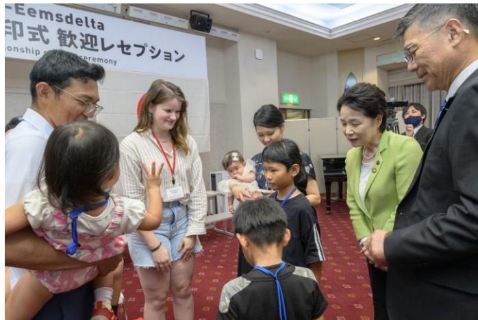
ホストファミリーとの対面・交流