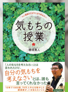
気もちの授業 (青春出版社)