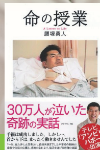
命の授業 (ダイヤモンド社)