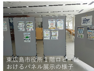
東広島市役所1階ロビーにおけるパネル展示の様子

今後も市民の方に矯正を身近に感じていただけるように、地域と連携して各種広報の展開などを行っていきたく考えています。