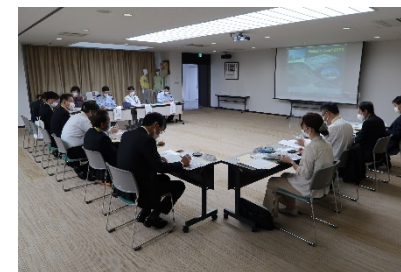
島根あさひ社会復帰促進センターにおける意見交換会の様子

9月29日に山口刑務所で、10月17日に島根あさひ社会復帰促進センターで農福連携に係る意見交換会が実施されました。