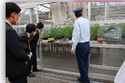
島根あさひ社会復帰促進センターの施設見学の様子