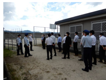
山口刑務所の施設見学の様子