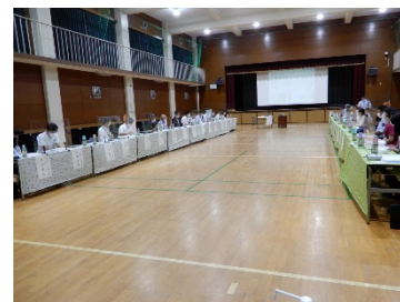
山口刑務所における意見交換会の様子