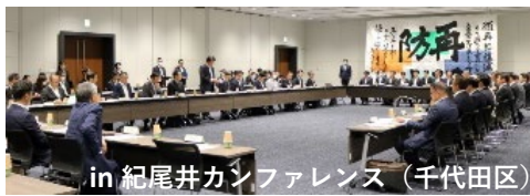
in 紀尾井カンファレンス（千代田区）