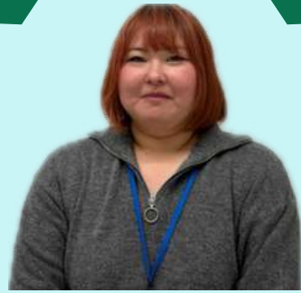
大元さん 鼓南・菊川 富田・福川